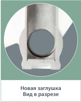
Новая заглушка Вид в разрезе